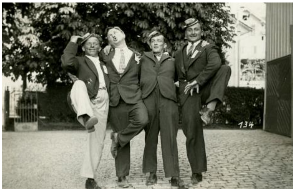
Stöffeli und Co.

teilzunehmen und belegte dabei den ersten Rang mit dem Prädikat «Vorzüglich». - 1956 galt es Abschied zu nehmen von der guten, alten «Krone». Jahrzehntlang war sie das Stammlokal der Musikanten gewesen, der Abschied fiel vielen schwer und dauerte etwas länger als eine ganze Nacht.